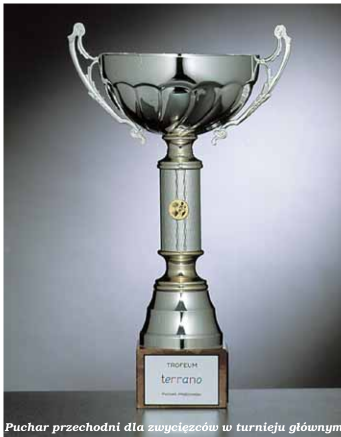
Puchar przechodni dla zwycięzców w turnieju głównym

Memoriał pod patronatem Prezydenta Miasta Poznania