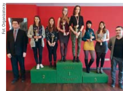
Pary dziewcząt U-25