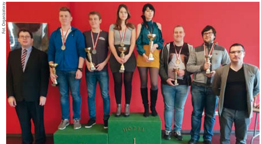
Pary open U-25

Rozgrywający 3BA Patrik otrzymał wist kierowy, który został pobity asem przez obrońcę E , po czym nastąpiła kontynuacja wybijająca jedyne zatrzymanie w ręku rozgrywającego. Patrik, by sprawdzić, co się w tym rozdaniu dzieje, zagrał ♠W. W wstawił króla, pobitego w stole asem. Teraz zagrana została ♦10, którą na pozycji E szybko przepuszczono, wobec czego szansa lokalizacji ♦D w tej ręce wyraźnie spadała. To skłoniło rozgrywającego do zagrania z góry, a że prócz damy sypała się też ♦9, rozgrywka zakończyła się pełnym sukcesem.