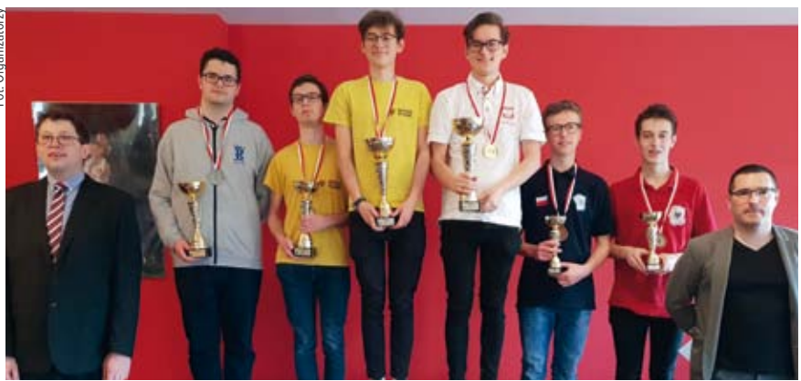
Pary open U-20