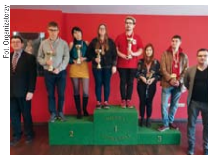
Pary mikst U-25