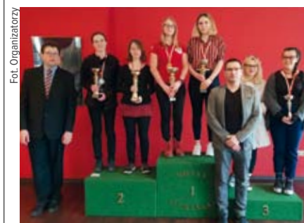
Pary dziewcząt U-20

w mocnym przeciwieństwie brydżowo kraju. Tymczasem gdyby nie fakt, że część zawodników przyjeżdża zagrać w dużej mierze po to, by spędzić czas z dawnymi (tak!) znajomymi, frekwencja ta byłaby jeszcze gorsza. Rokrocznie dziwimy się, że w turniejach par dziewcząt trudno dobić do 10 duetów, nie mając świadomości, że w dwóch rocznikach kategorii 19–20 lat jest obecnie niewiele ponad 20 (!) dziewcząt aktywnych jeszcze brydżowo, z opłaconą składką członkowską PZBS. To tu jest pies pogrzebany – że nie potrafimy młodych ludzi w obliczu matury i studiów zatrzymać przy brydżu. Z zazdrością, ale i bez większego