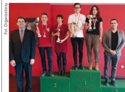
Pary mikst U-20