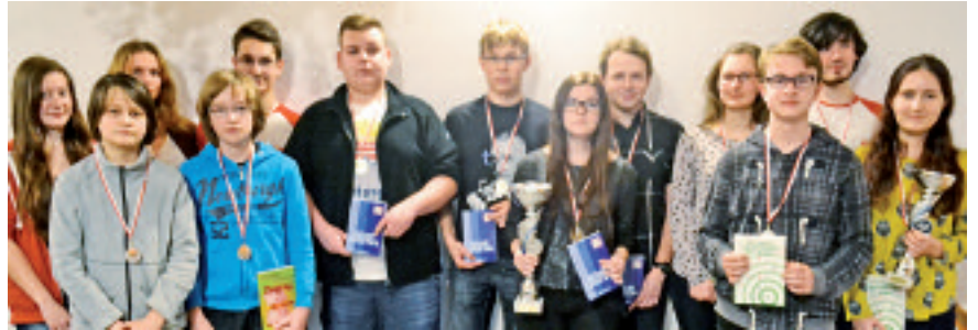
8. edycja Małopolskiej Ligi Młodzieżowej: MZBS CKIS [2. miejsce], MPEC CKIS [1], MPEC II Tarnów [3.]