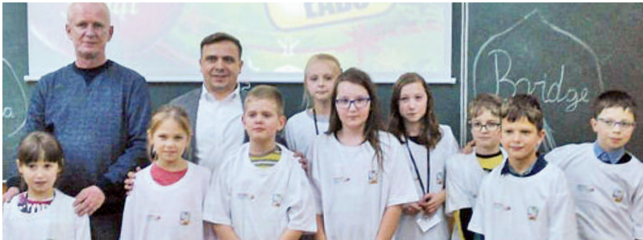
Łomżyńscy adepci brydża sportowego

Duże i małe ośrodki brydża młodzieżowego: Łomżyńska Akademia Brydża Sportowego